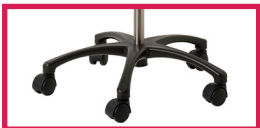
NEW Nouvelle base ABS design