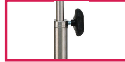
ACC 320BGS Bague de serrage inox